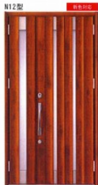
N12型 キングストーンオーク