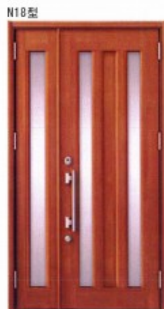
N18型 ミディアムチェリー