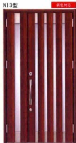
N13型 ハンドダウンチェリー