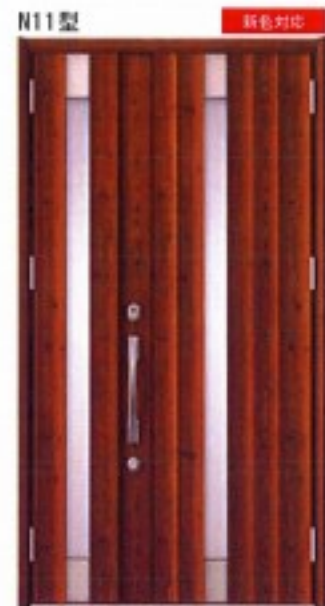
N11型 アイリッシュハイン