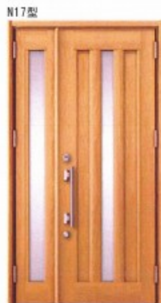
N17型 スナッグウォールナット