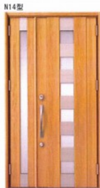
N14型 スナッグウォールナット