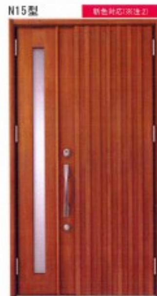
N15型 ミディアムチェリー